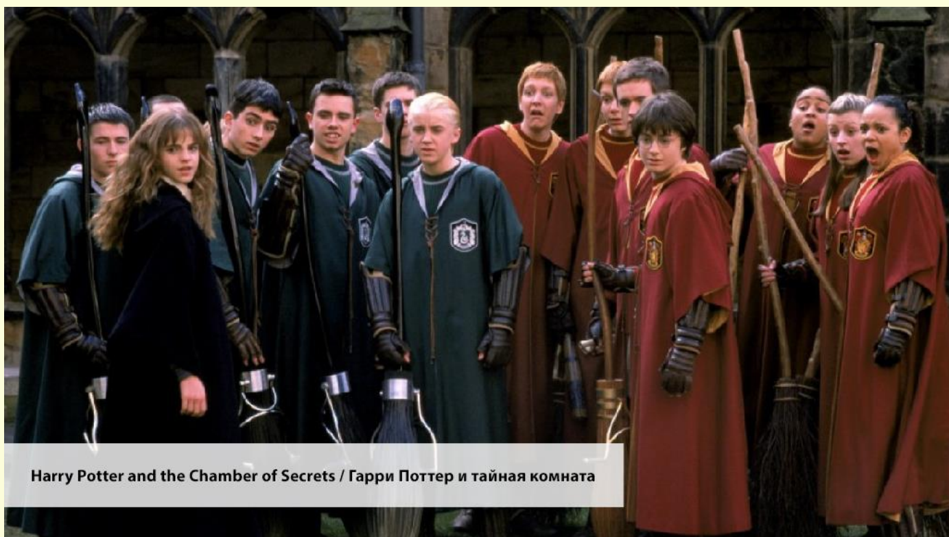
Harry Potter and the Chamber of Secrets / Гарри Поттер и тайная комната

— I will be writing to your families tonight, and you will both receive detention.