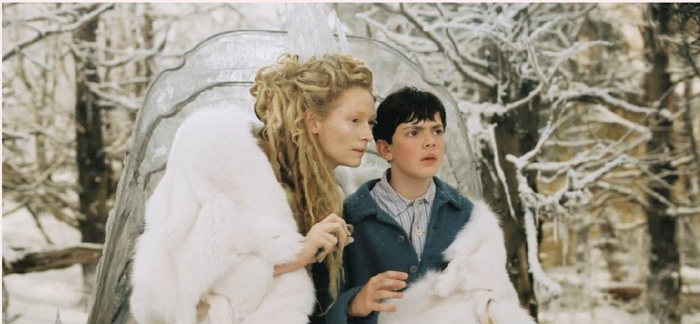
The Chronicles of Narnia: The Lion, the Witch and the Wardrobe / Хроники Нарнии: Лев, колдунья и волшебный шкаф

He will have noticed that she is highly nervous. — Он, вероятно, заметил , что она сильно нервничает.