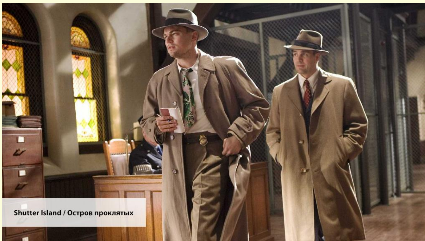
Shutter Island / Остров проклятых

He was astonished when I told him the news. — Он был поражен, когда я сообщил ему эту новость.