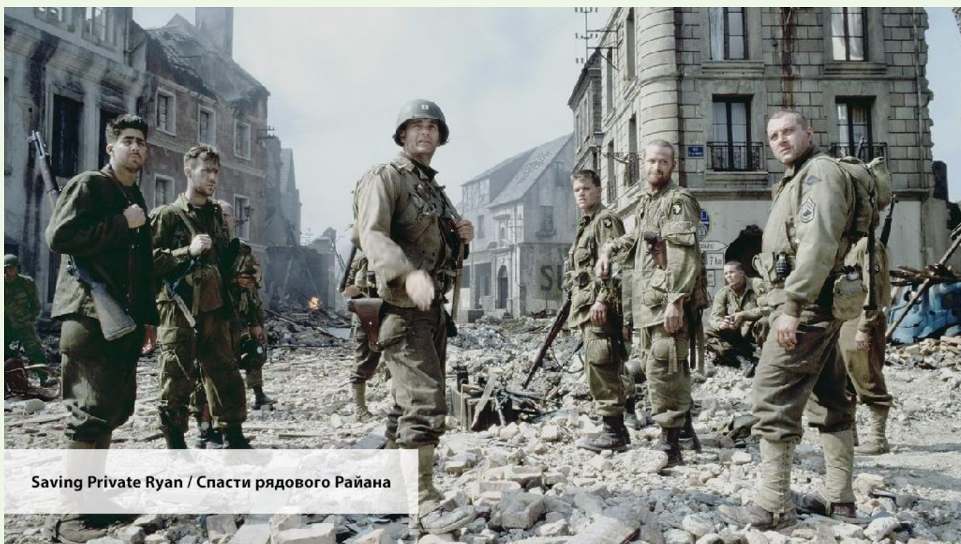
Saving Private Ryan / Спасти рядового Райана

— The Germans have been reinforcing regiments all day.