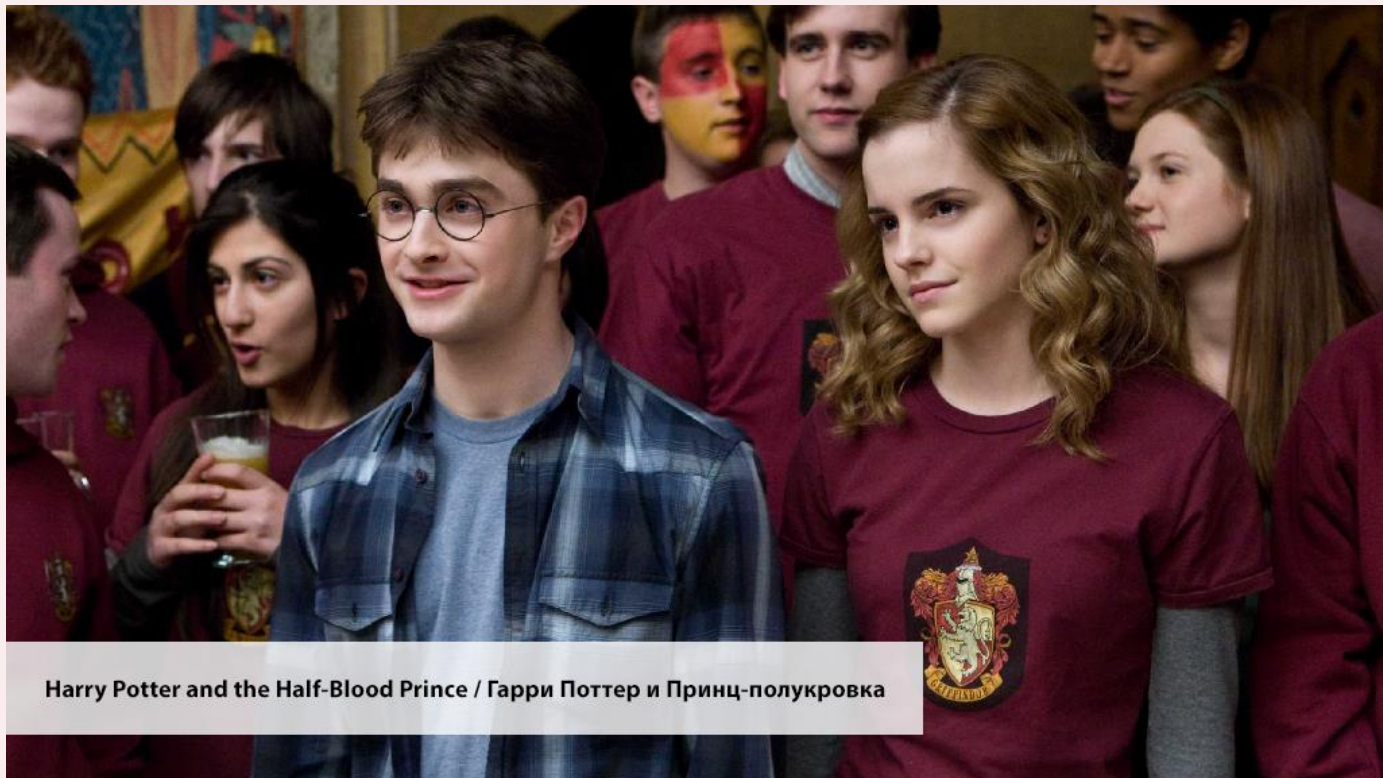
Harry Potter and the Half-Blood Prince / Гарри Поттер и Принц-полукровка

plans. — Они думали купить дом, но он потерял работу, и им пришлось отложить свои планы.