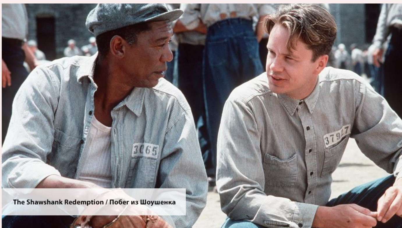
The Shawshank Redemption / Побег из Шоушенка

— If I were you, I'd grow eyes in the back of my head.