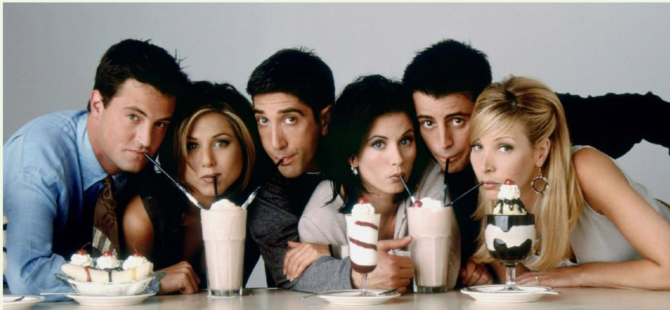
Friends / Друзья

She was watching TV in the afternoon. — Она смотрела телевизор днем . (то есть день уже закончился, наступил вечер)