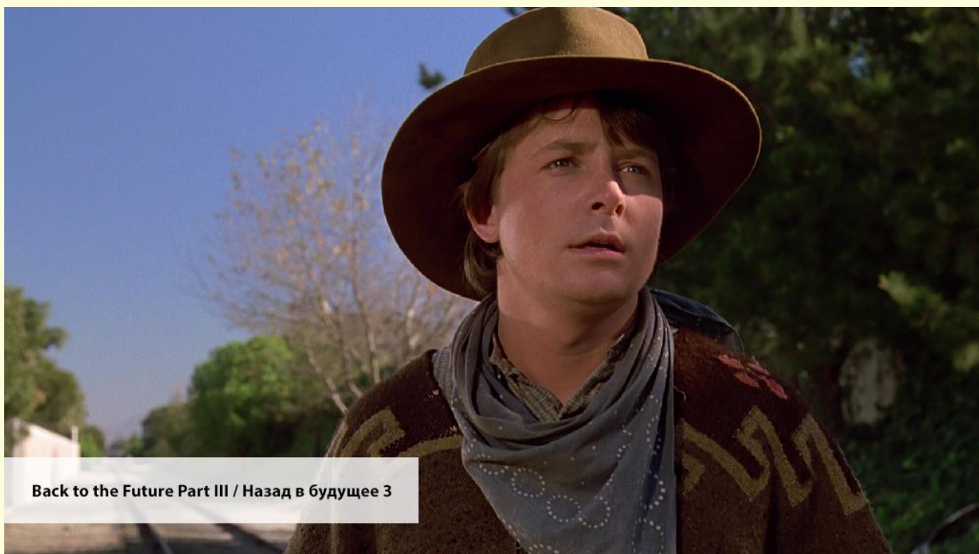
Back to the Future Part III / Назад в будущее 3

— I'll help you find your blacksmith friend.