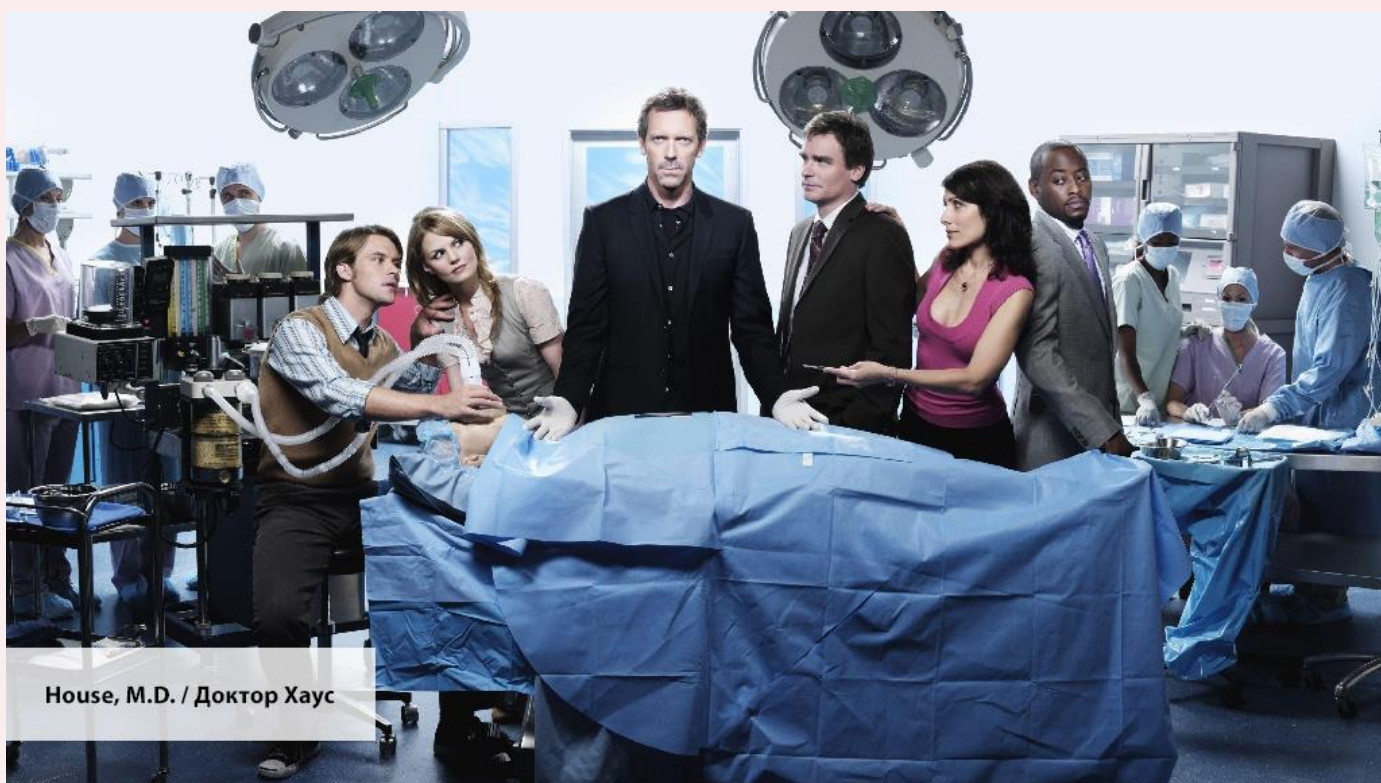
House, M.D. / Доктор Хаус

I never talk on the phone when I am eating . — Я никогда не разговариваю по телефону, когда ем .