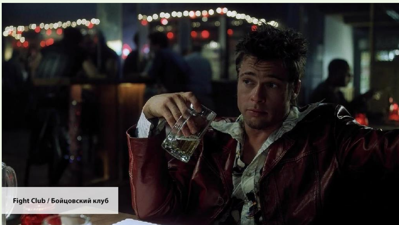
Fight Club / Бойцовский клуб

Hold on. I' ll get a pen. — Подожди, я достану ручку. (появилась необходимость что-то записать, поэтому я сразу озвучил, что надо взять ручку)