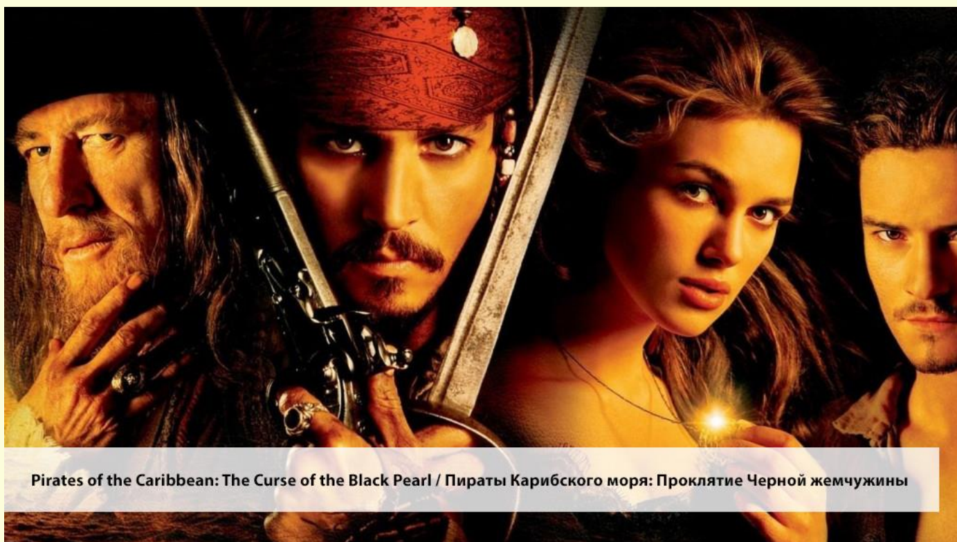
Pirates of the Caribbean: The Curse of the Black Pearl / Пираты Карибского моря: Проклятие Черной жемчужины

— That's the second time I've had to watch that man sail away with my ship.