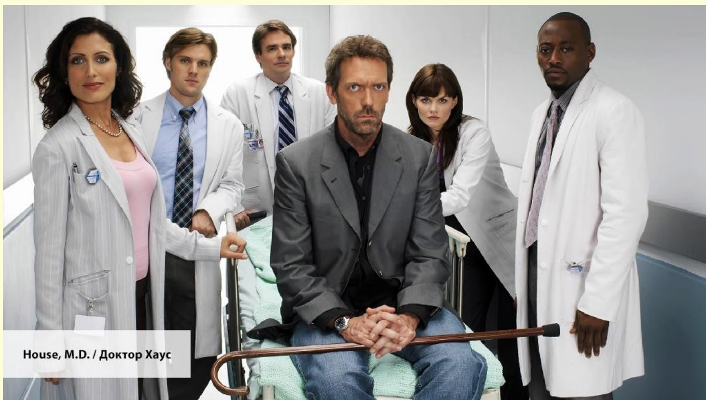
House, M.D. / Доктор Хаус

— Choose a statement in each group that best describes how you've been feeling lately, including today.