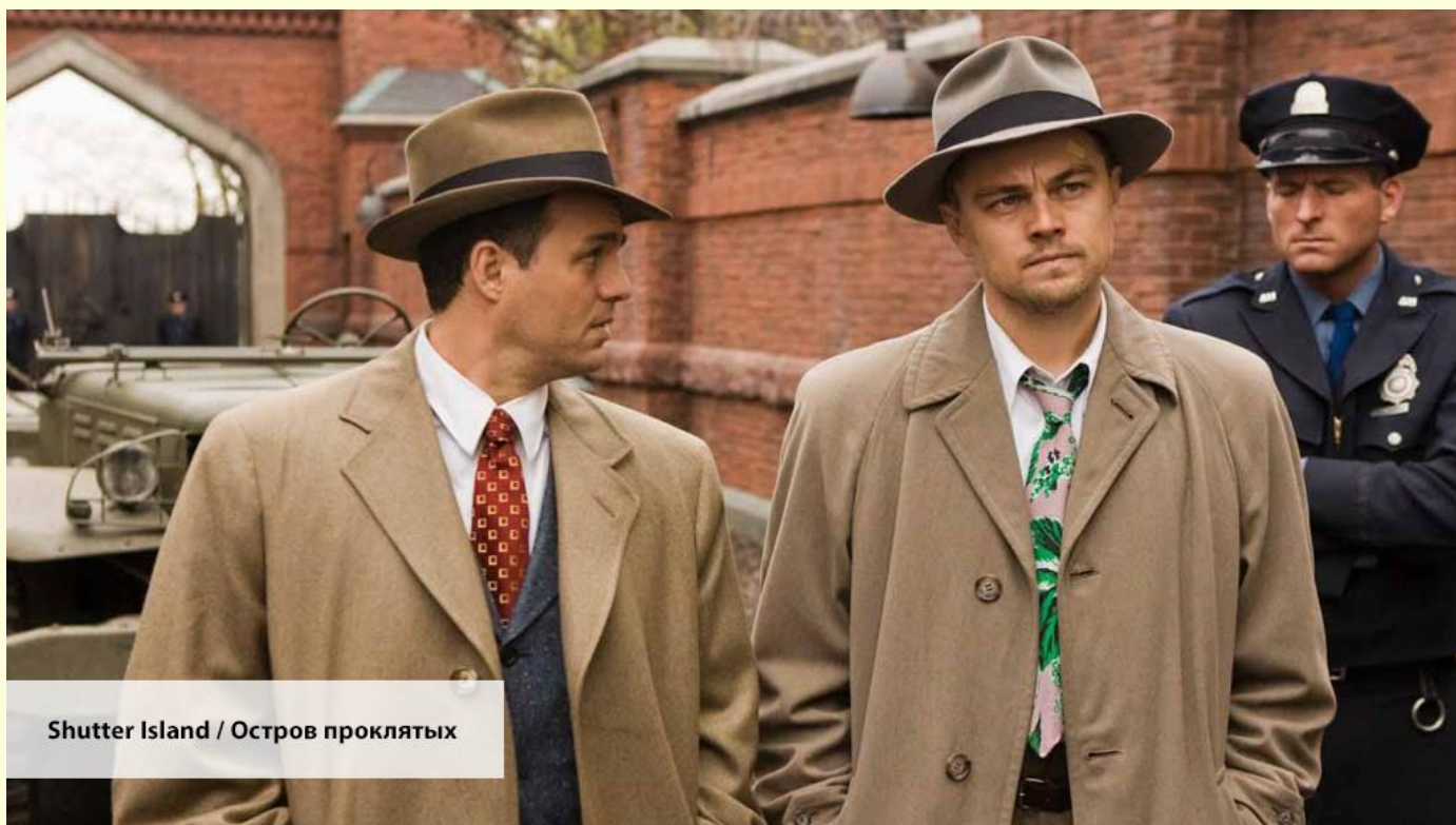
Shutter Island / Остров проклятых

I was writing a letter to my friend in Brazil while my wife was cooking dinner. — Я писал письмо другу в Бразилию, пока моя жена готовила ужин.