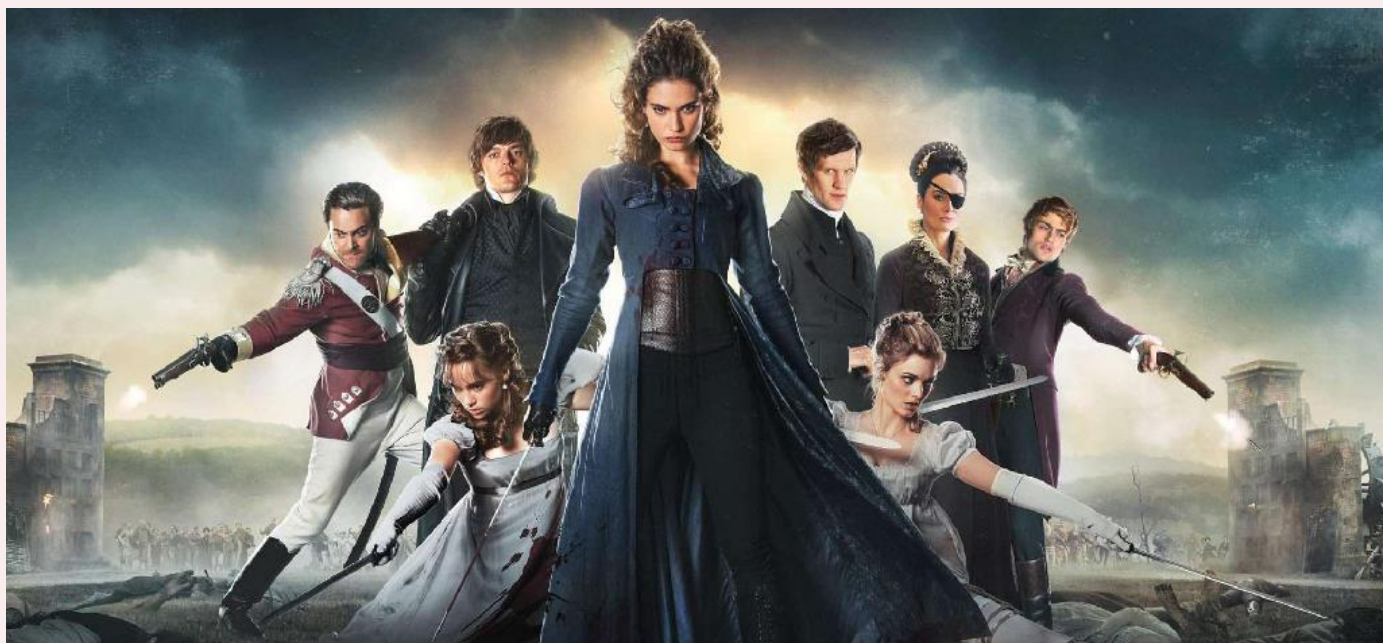
Pride and Prejudice and Zombies / Гордость и предубеждение и зомби

No sooner had I chewed my sandwich than somebody knocked at the door. — Не успел я прожевать свой сэндвич, как кто-то постучал в дверь.