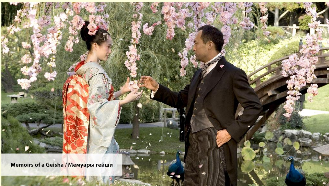
Memoirs of a Geisha / Мемуары гейши

— The Chairman needed me. But I was a far cry from the Geisha I had once been.