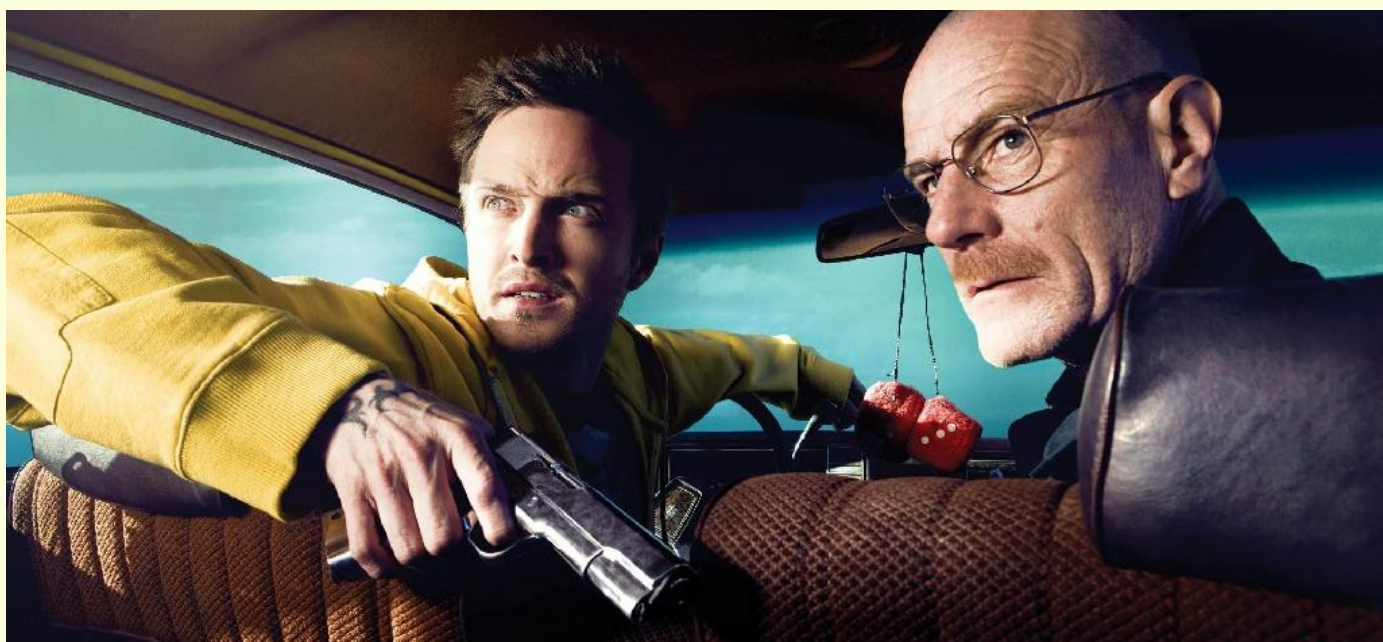
Breaking Bad / Во все тяжкие

— This close family friend had been keeping a secret from you and Hank, and somehow this person's secret became known, and now you're sad and hurt and angry.