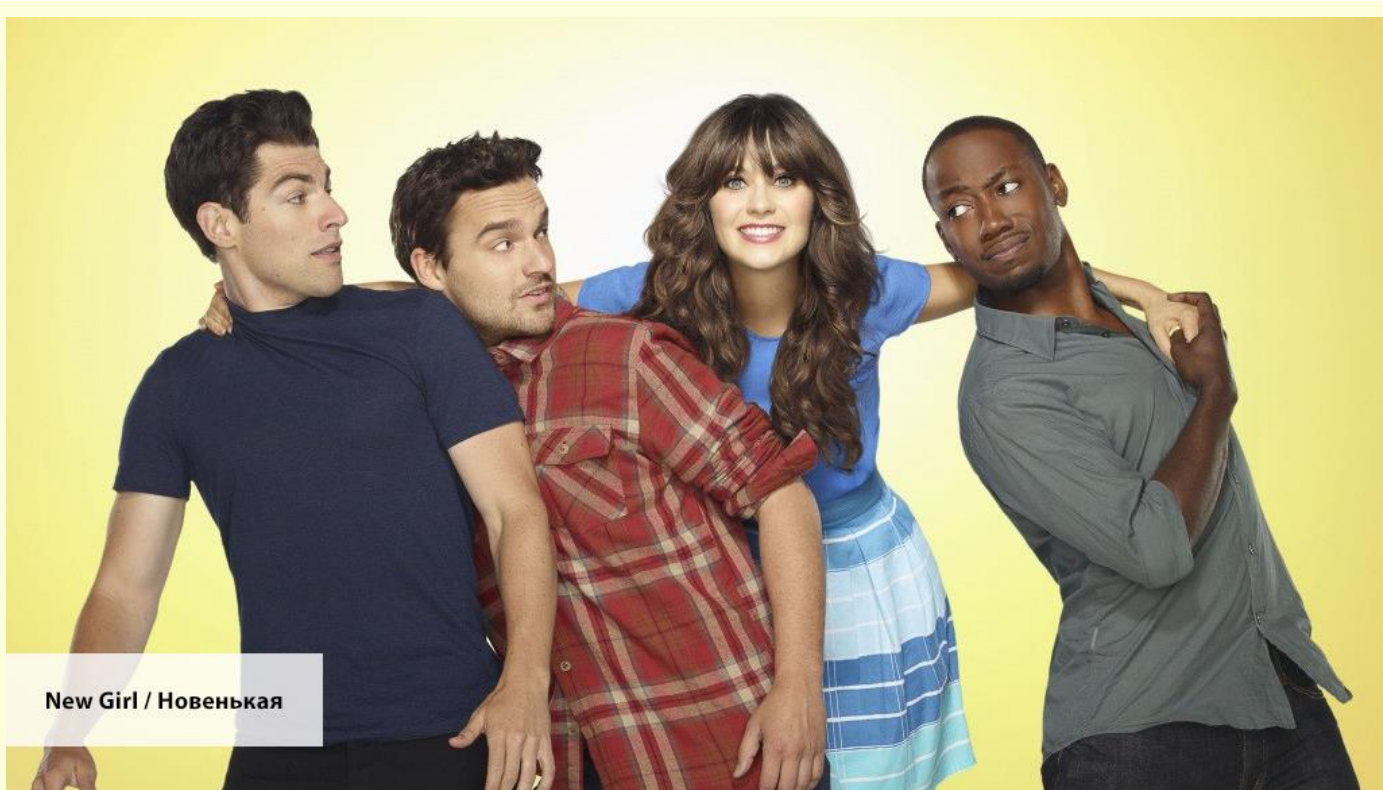
New Girl / Новенькая

— In March, I will have been living with Schmidt for 10 years. I know that because he sent me an e-mail asking how I want to celebrate our tin anniversary.