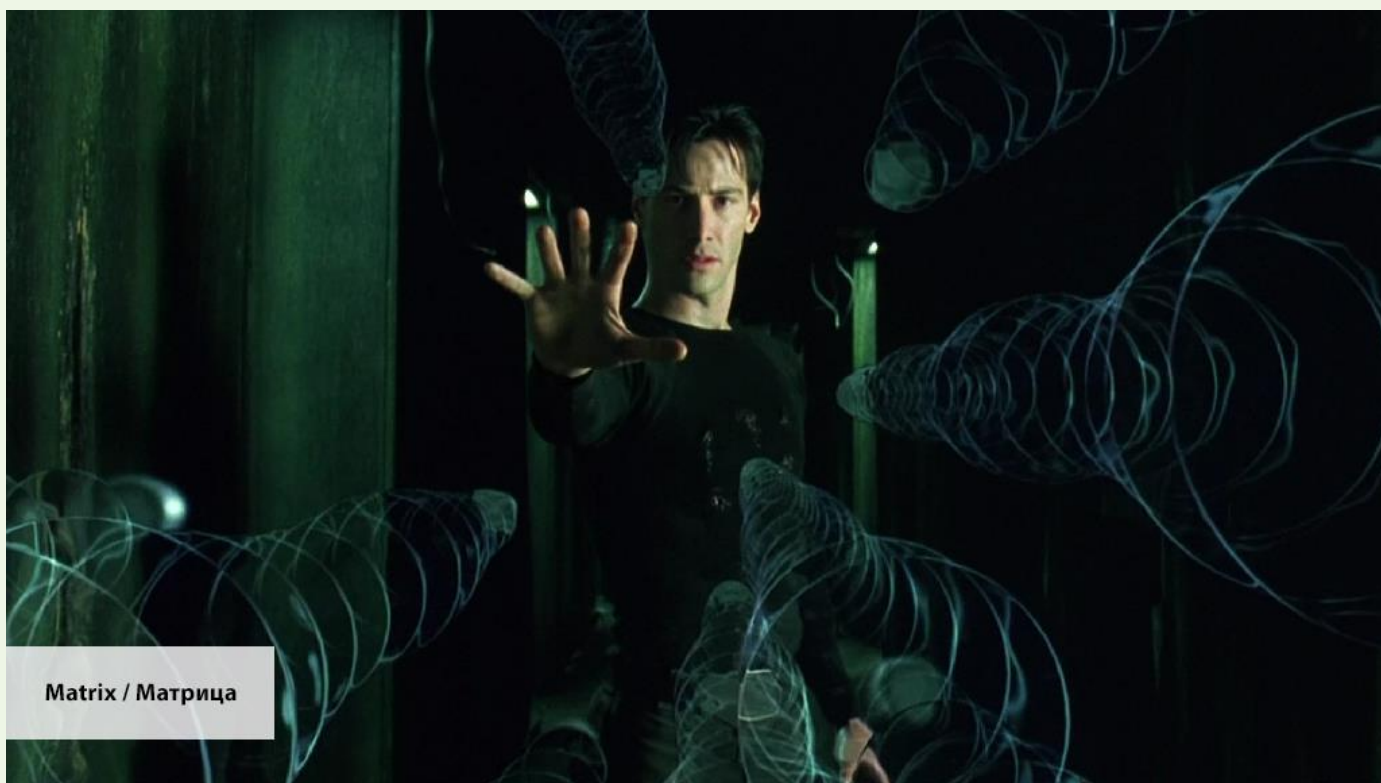
Matrix / Матрица