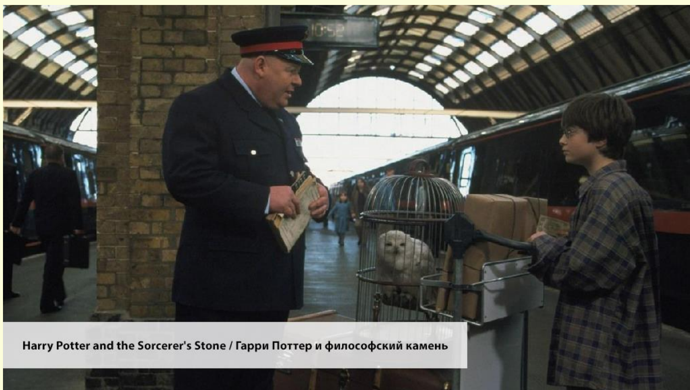
Harry Potter and the Sorcerer's Stone / Гарри Поттер и философский камень