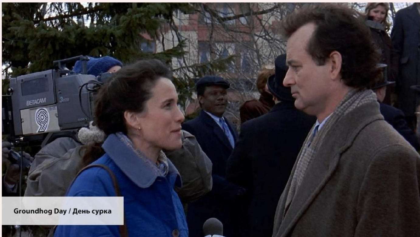
Groundhog Day / День сурка

Have you invited any of your friends since you've lived in your new apartment? — Ты приглашал кого-нибудь из друзей с тех пор, как живешь в новой квартире?