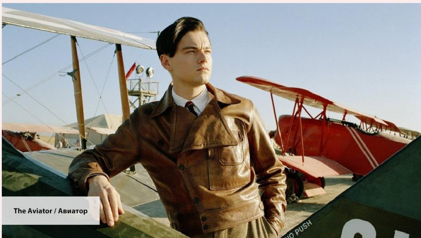
The Aviator / Авиатор

— Sources whisper that young Texas industrialist Howard Hughes just won't stop pouring money into his war epic.