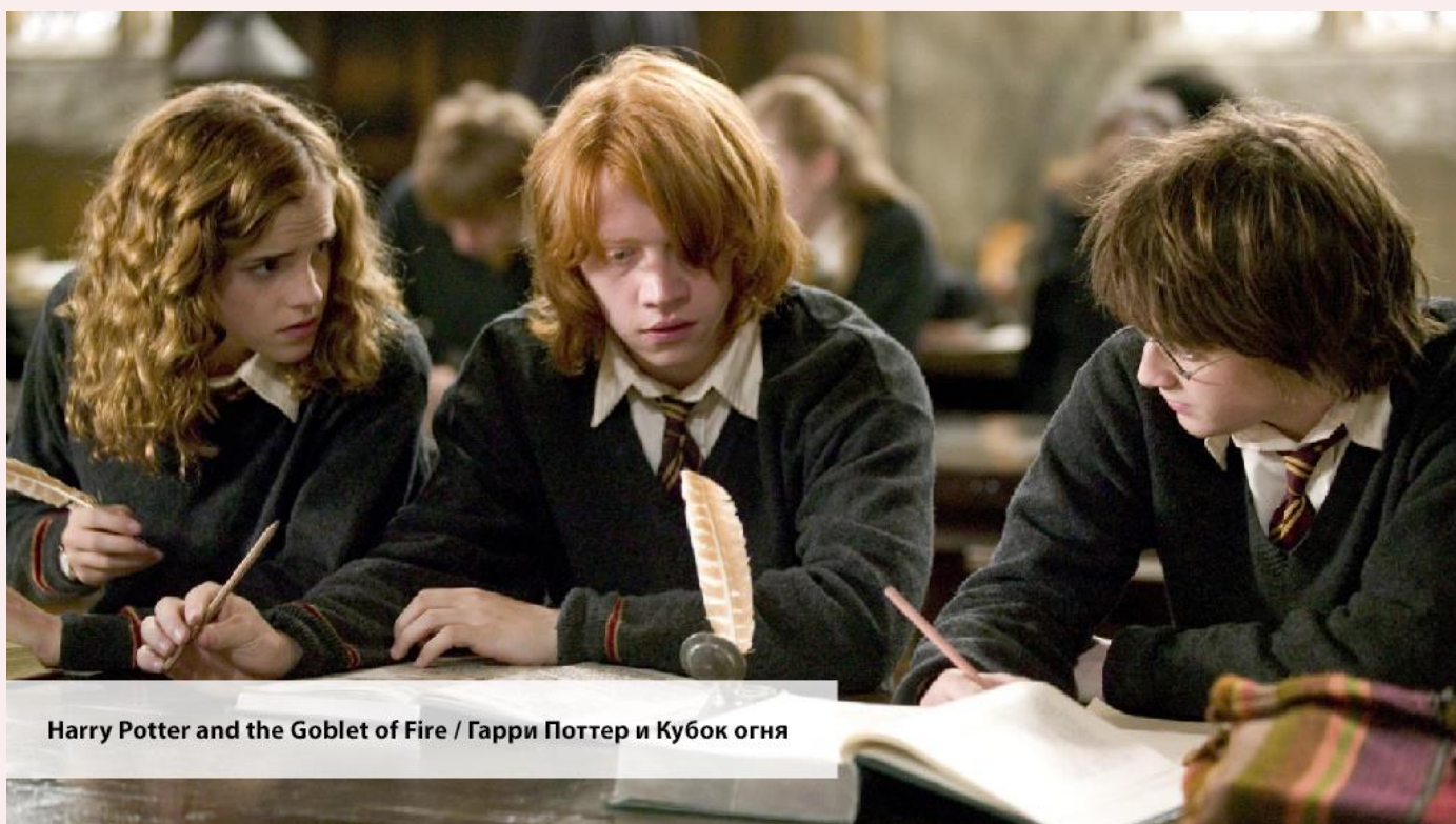
Harry Potter and the Goblet of Fire / Гарри Поттер и Кубок огня

— I won't be going alone, because, believe it or not, someone's asked me!