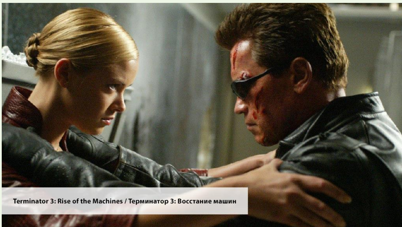
Terminator 3: Rise of the Machines / Терминатор 3: Восстание машин

— By the time SkyNet became self-aware it had spread into millions of computer servers all across the planet.