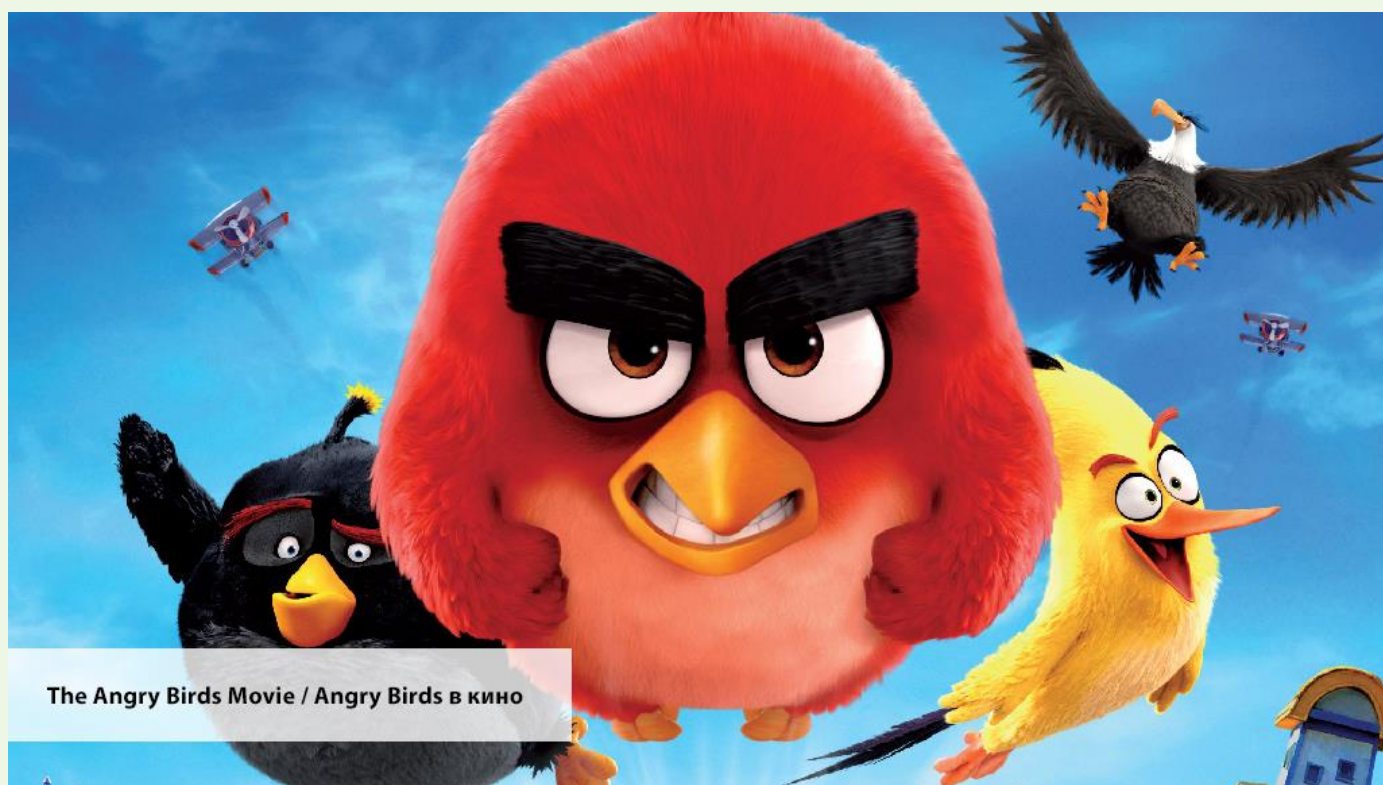
The Angry Birds Movie / Angry Birds в кино

— You're wrecking my house. What's wrong with you?