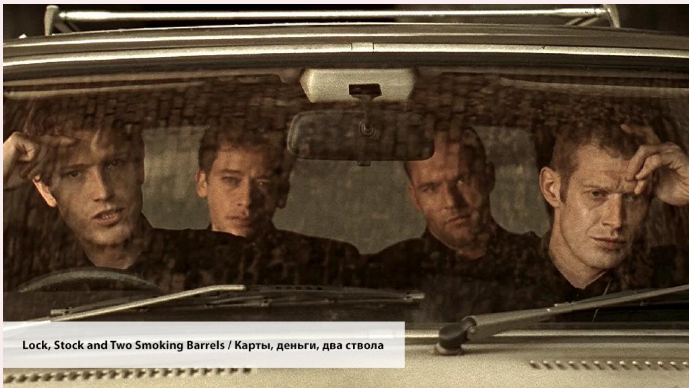
Lock, Stock and Two Smoking Barrels / Карты, деньги, два ствола

Silvia has been playing tennis since she was ten. — Сильвия играет в теннис с тех пор, как ей исполнилось десять. (она занимается теннисом с десяти лет)