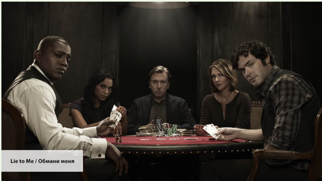
Lie to Me / Обмани меня

That museum had a great collection of paintings. — В том музее была огромная коллекция картин. (сейчас в музее нет огромной коллекции)