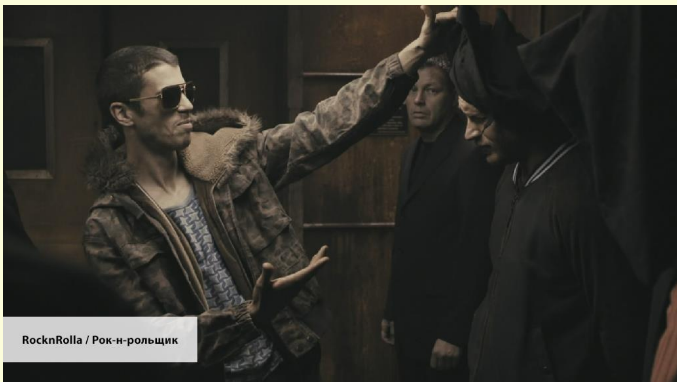
RocknRolla / Рок-н-рольщик

I am having a business meeting tomorrow . — У меня деловая встреча завтра . (встреча уже назначена и точно состоится)