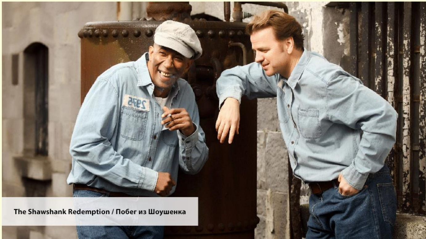
The Shawshank Redemption / Побег из Шоушенка

He will have bought a new car before his wife comes back from a trip to London. — Он купит новую машину перед тем, как его жена вернется из поездки в Лондон.